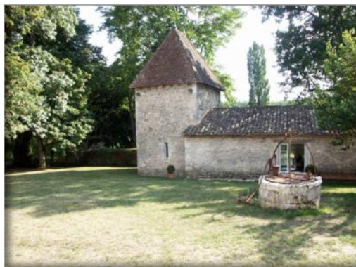
Vue de face du bâtiment (accès principal)

Bâtiment indépendant sur la propriété de plus de 70 M2, cet espace de détente privatif propose un jacuzzi professionnel, un hammam et une petite piscine intérieure (non chauffée pour utiliser avec le Hammam). Espace tout confort, vous y trouverez également une douche, un WC et une grande terrasse de 30 M2 donnant sur la campagne.