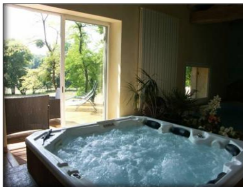
Jacuzzi avec vue sur la campagne